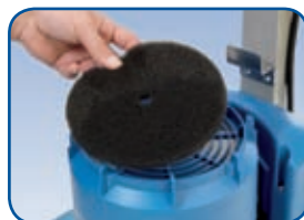
Filtro Motore Hi-Dust optional