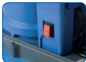
Selezione doppia velocità