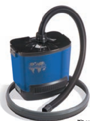
Kit aspirante optional Dustrol

Nel modello HFT sono presenti tutte le numerose specificità della linea Hurricane ma con il vantaggio, quando serve, di avere due velocità.