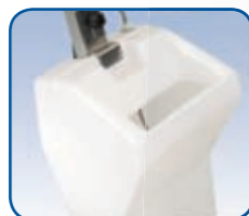
Largo serbatoio optional

Tutti i modelli HFS adottano il sistema ATC, Controllo Automatico di Coppia, che monitora e bilancia la potenza operativa d'ingresso durante tutto il ciclo di lavoro.