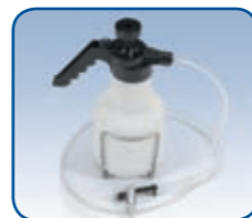
Kit opzionale Spray Clean

La potente trasmissione a bagno d'olio garantisce un'ottima maneggevolezza